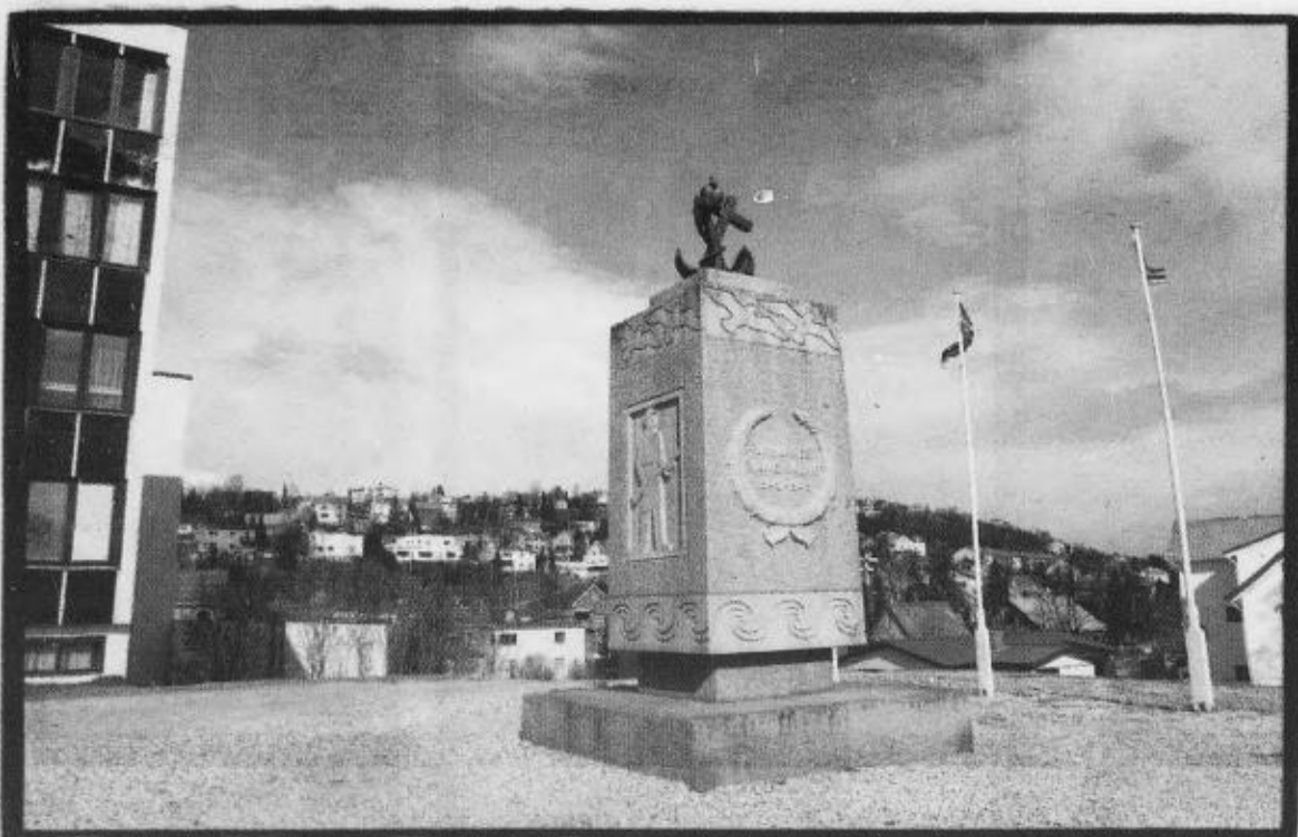
47 ÅR GAMMELT: Minnesmerket ble avduket på 17. mai i 1957, foran 2.000 mennesker.

Neste lørdag: Minnesmerket over fangeleiren på Krøkebærsletta