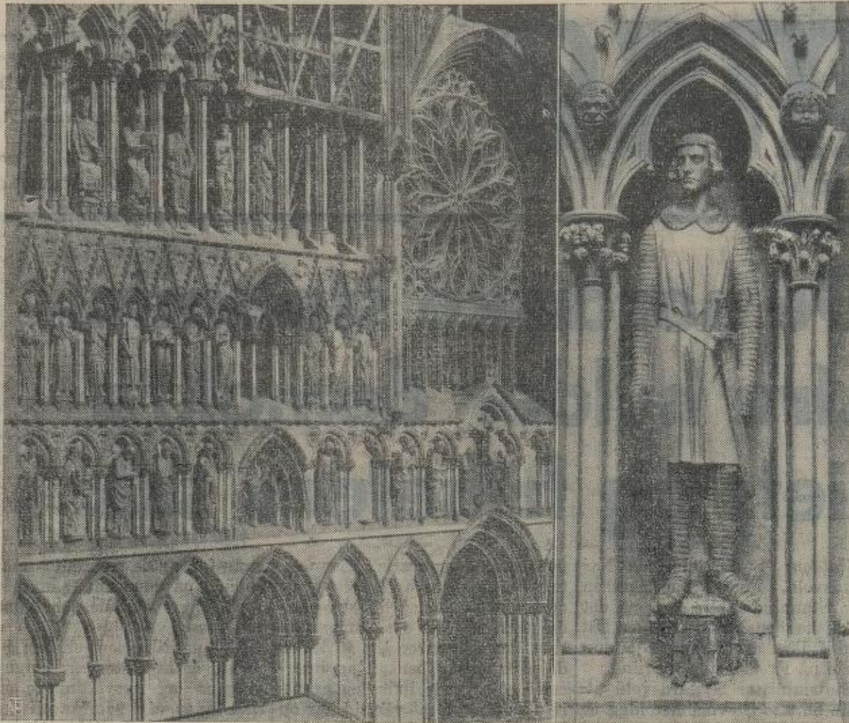
Tiltakskommissjonen for Nidarosdomen har holdt møte i Trondheim og tatt i siesyn de mange nye vakre skulpturer på vestfrontens nordside.