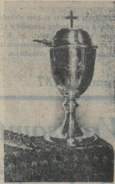
Den gamle ordning med bruk av felleskalk under utdelingen av nadverdvinen er i sambye med de skjerpede hygieniske krav mere og mere avløst av særkalker.

1) Hammerfest kommune vedtar de i skrivelse av 8. juni 1939