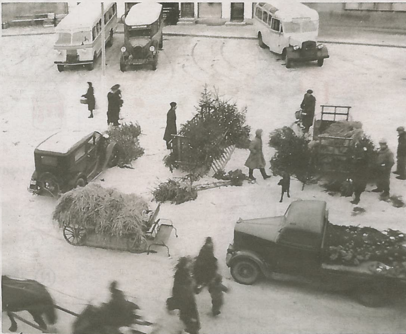
AAGAARDS Plass: Det er noe usikkert når dette bildet er tatt, men det viser juletre salget slik det foregikk kanskje på 1940-tallet.

Jentene likte ikke bare appelsinene, det var papiret rundt som lokket med strålende farger og symboler. Jaffa-appelsinene husker jeg best. Papiret ble