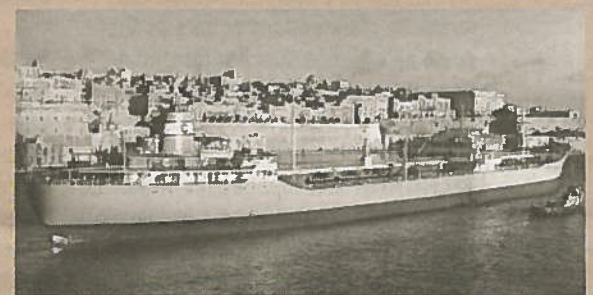
TT Thorshall på havnen i Valetta på Malta.