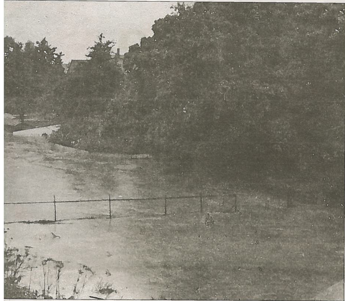
Den 24. august 1950 gikk Ruklabekken over sine bredder samtidig som springflo og høyvann satte deler av Sandefjord sentrum under vann. Etter denne oversvømmelsen ble den såkalte "Bøkanalen" bygd for å ta unna overvann fra store nedbørsmengder.

nede i løpet) kom fra nedre del av Moveien, Lunden og Åslyparken og var innom begge husmannsplassene Øvre og Nedre Myra før den gikk under «Armogaden» (Landstads gate) og «Langgaden» (Kongens gate) og løp til sist ut i Ruklabekken ved «Braade Bro» på sydsiden av Torggata ikke langt fra Thor Bryns gate.