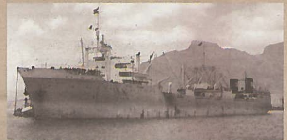
Kosmos III på havnen i Cape Town.