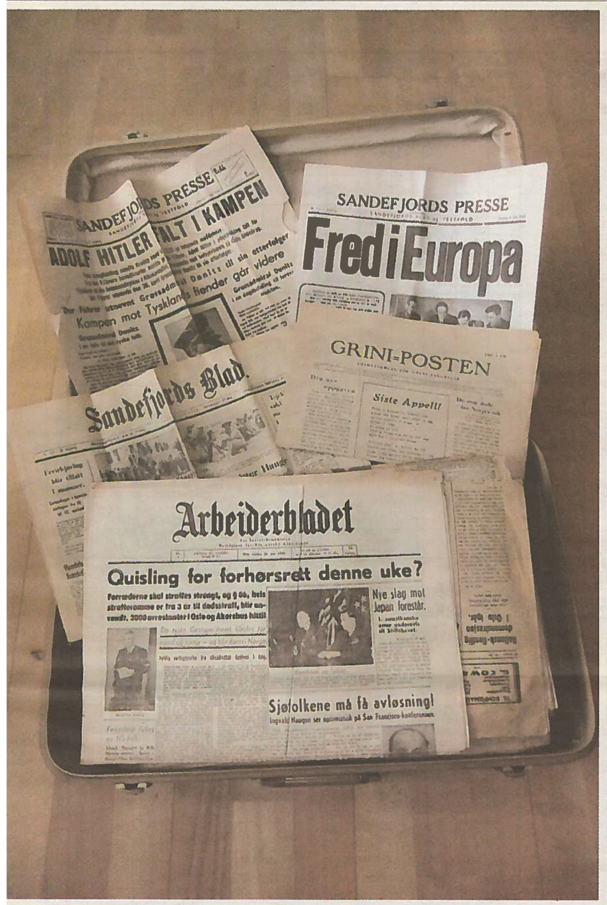
Gamle kofferter på loftet kan ofte romme mye rart!