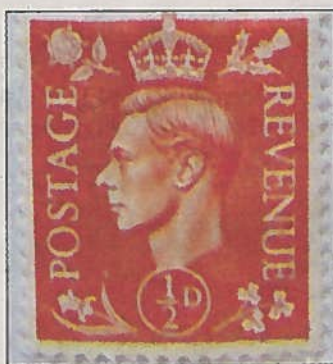
Den mest synlige mann på all verdens frimerker i 1952 var nok Kong Georg VI av England.

Han må ha vært en flittig brevskriver for maken til mange og fine frimerker vi fikk