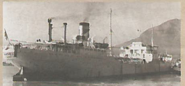
«MT Sandar» på redan i Cape Town.