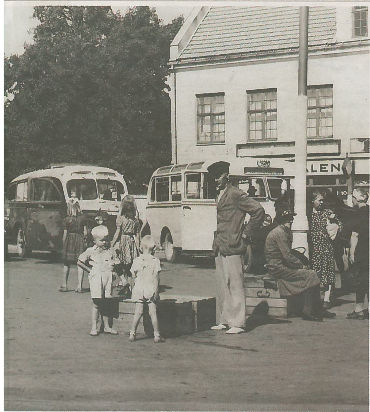
Bussholdeplassen på Ågårdstomta var kommunikasjonssenteret for alle som ikke bodde i byen i årene etter krigen. De to bussene til høyre står klare for avgang til Åbol-Fevang-Gjein og til Skolmerød-Furustad. Venterom med pakkesentral var det bak bussen til høyre. Og det var nesten aldri noe frukt fra det store pæretreet i hagen bakenfor som falt ned på fortauet mens du ventet på bussen om høsten!