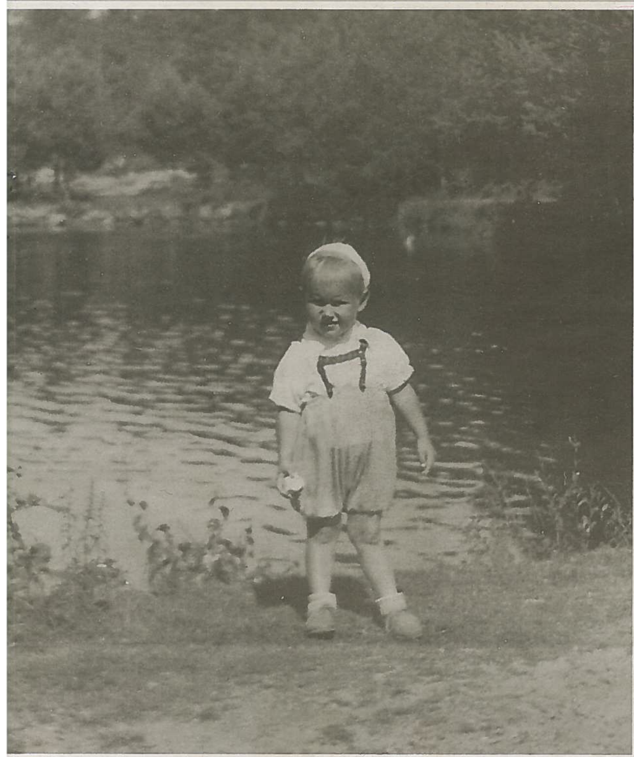
Artikkelforfatteren fotografert ved Brydedammens bredd som to-åring på fredsdagen i 1945.