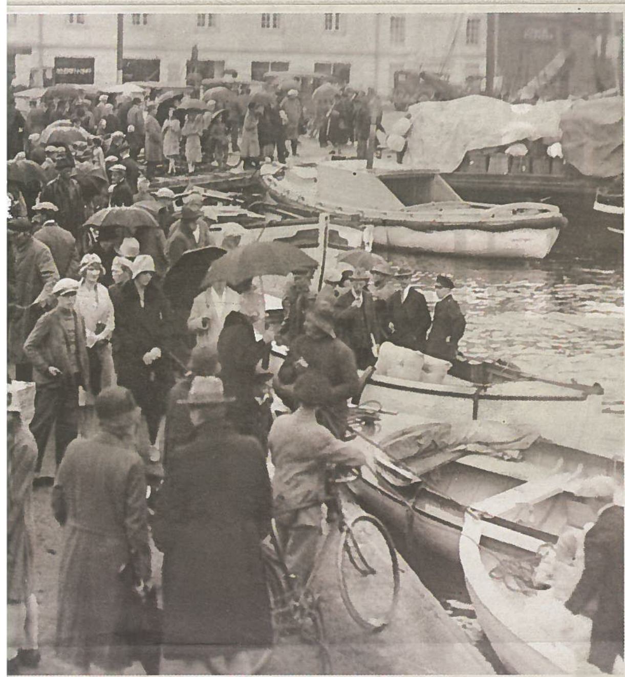
Mange møtte fram ved hvalfangernes avreise fra Sandefjord i mellomkrigstiden.