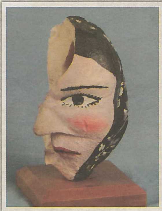
Fotoet viser et dekorert hvaløre.

Disse antagelsene stemmer imidlertid ikke helt, og et