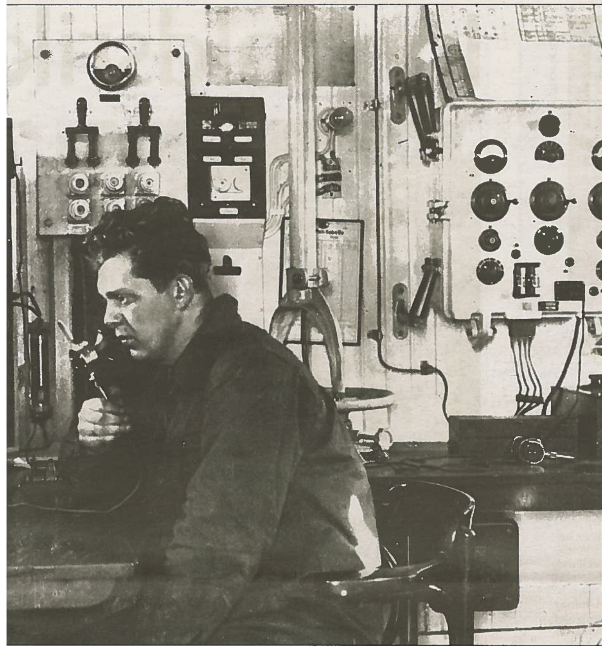
Telegrafist i arbeid på FLK «Antarctic» i 1930.