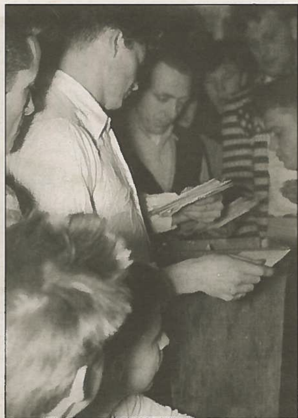
Brevutdeling om bord på et hvalkokeri, trolig tidlig 1950-tall.

igjen et tydelig preg på familienes hverdagsliv hjemme. For kvinnenes del betydde det for eksempel ofte at de måtte ta løpende avgjørelser i forhold til barna og husholdet nærmest på egenhånd dersom noe inntraff mens mennene var ute. For mange kunne det å ha lite kontakt med ektefellen også være utfordrende rent følelsesmessig, og flere forhenværende hvalfangerhustruer forteller at de opplevde det som at det reelle