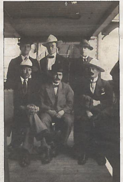
Hunden var ofte et viktig innslag om bord. Her fikk den sitte på fanget under fotografering.

Kilder: Hvalfangstens tradisjonsmateriale i Vestfold, Hvalfangstmuseets arkiv, Hvalfangstmuseets fotoarkiv, private fotografier, Otto Opstad; «Skipshunder» (1996).