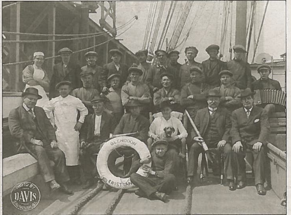
«Glendoon», et tremastet stålskip bygget i 1884. Skipet gikk under norsk flagg da det ble angrepet og senket av en tysk ubåt i Atlanteren under første verdenskrig. Hele besetningen ble trolig berget, kanskje også skipshunden som vi ser sitter på fanget til kapteinens frue.

Også om bord på hvalbåter forekom det hunder og katter. En hvalfanger forteller at de hadde katter ombord på «Thor I». Ei natt våknet han av et forferdelig spektakel inne i lugaren. Da han skulle tørne ut, fikk han se at støvlene lå over ende, og ved siden av satt katta på vakt. Inne i foten på sjøstøvelen var det ei rotte, og den var årsaken til spektaklet. Informanten tømte rotta ut og katta tok den med en gang. Det var så mye rotter om bord at kattene balanserte på køyekantene om natten. En annen hvalfanger forteller fra et kokeri at mannskapet hadde det moro med musene. «Vi fanget en del småmus så kattene kunne få leke med dem. Vi hadde mange katter. Katter var velkomne om bord.» En annen hval-