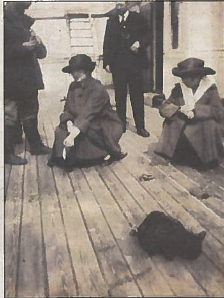
Kvinne med hatt og katt. Kapteinens frue mater katten med sild på dekk.

«MS Dagrund» gikk i trampfart og anløp havner verden rundt, så det sier seg jo selv at det passet dårlig og det ble etter hvert problematisk å ha det store dyret om bord og som ikke likte asiater. Det