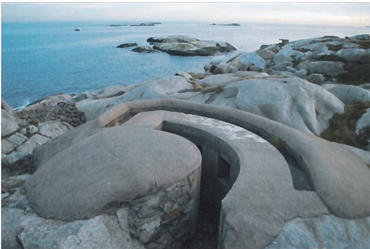
En maskingeværstilling bygget strategisk til på pynten, ut mot havet.

aktive unggutter som gjerne ville inn på fortet for å se. Han bodde oppe i det gule huset på toppen av fortet, og hadde en stor hund som ruslet rundt der ute, til guttenes store skrekk.