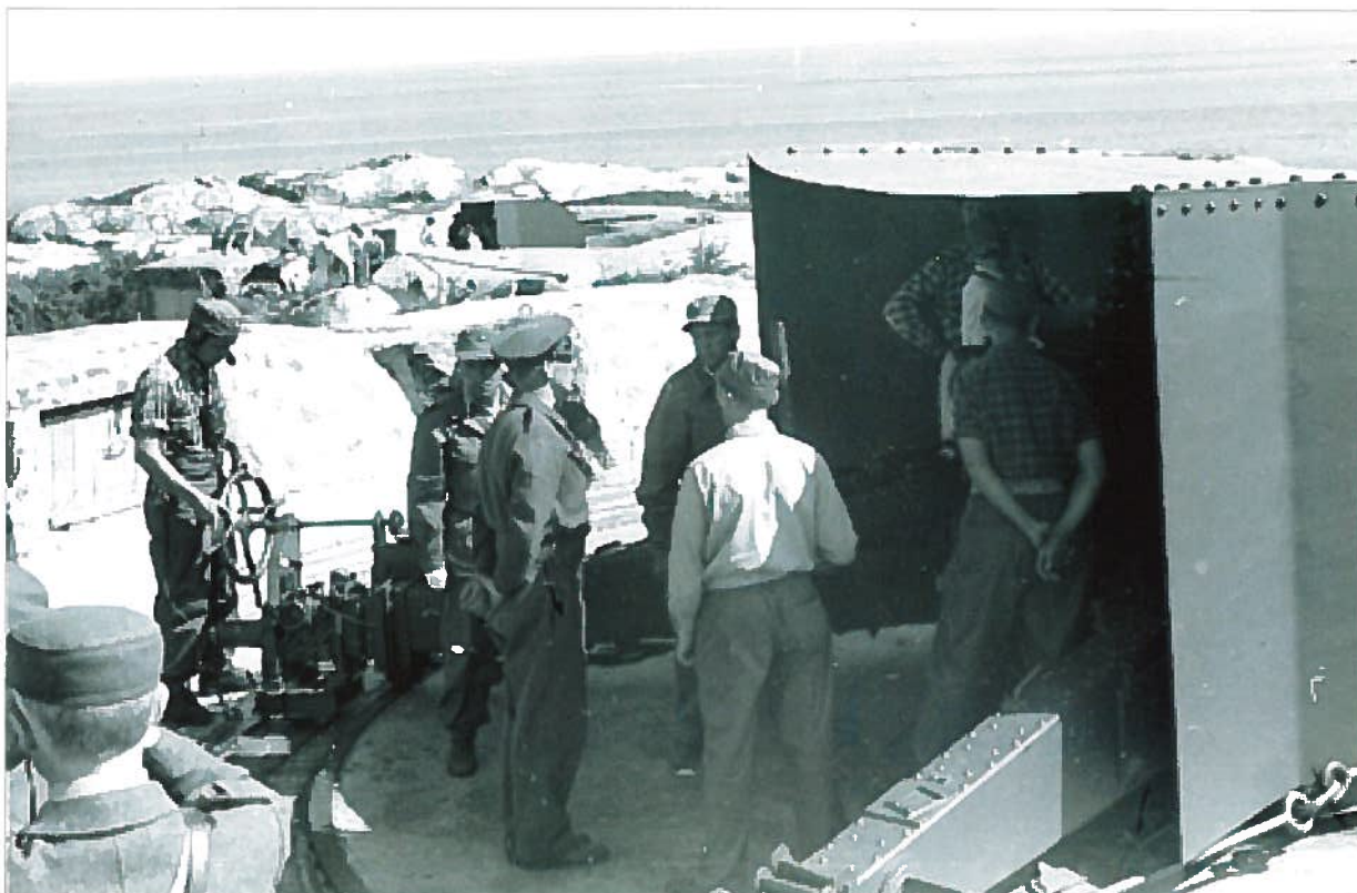
Norske heimevernsoldater under opplæring av det tyske kanonmateriellet, etter krigen.