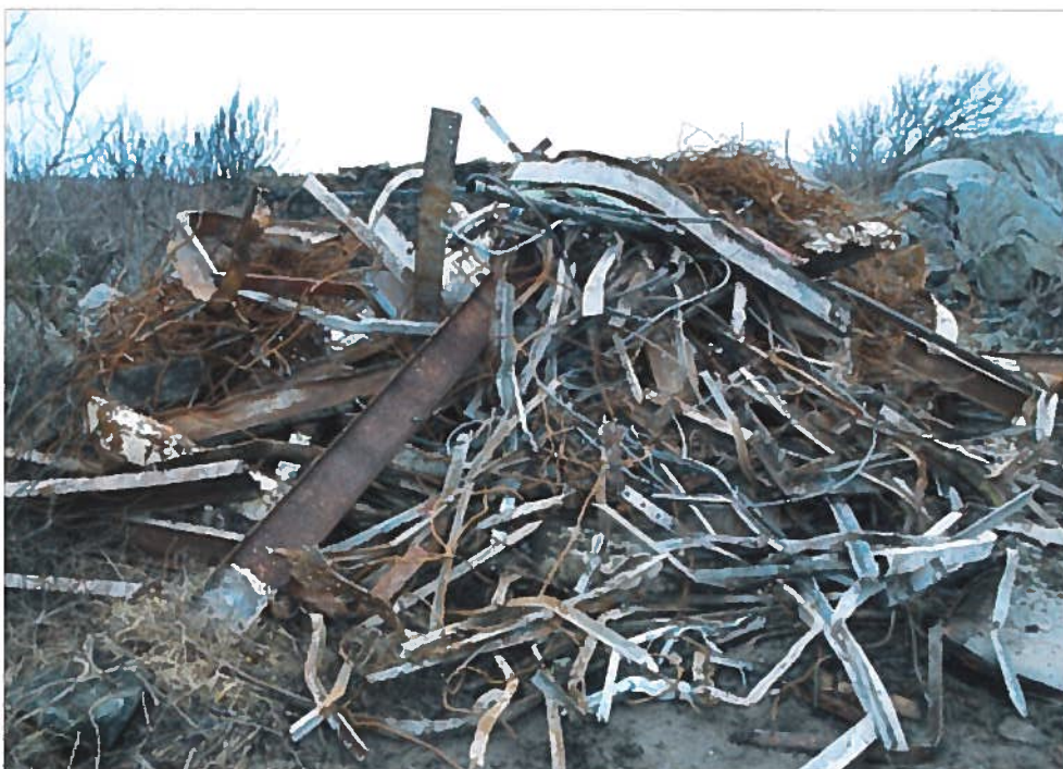
Armeringsjern, tatt ut fra noen av de bunkerne som er revet.

I tiden fremover var det flere norske vaktmenn som passet på det militære anlegget på Folehavna. Vaktbua var ved veien inn til fortet i bakken ned mot stranda som heter Folehavna. Det fortelles mange historier om disse vaktmennene som satt der ute natt og dag, blant annet var det en som satt seg i respekt overfor