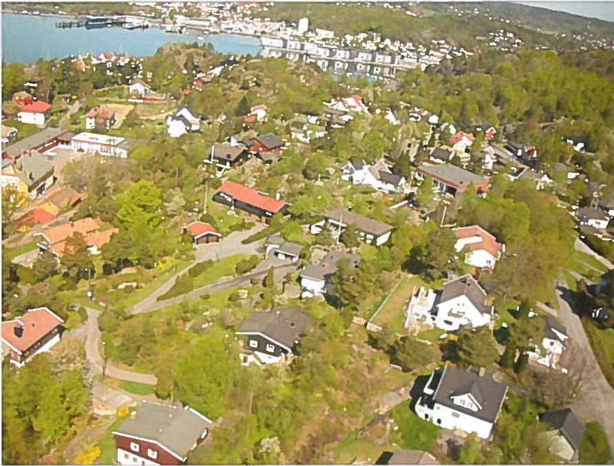
Det aller meste vi ser på dette bildet, er skilt ut fra Huvik gård. Den nåværende barnehagen og kirken ligger til høyre i bildet.