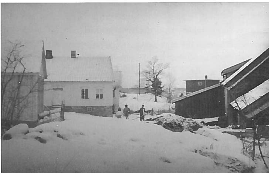
Gårdstunet på Huvik ca 1940.