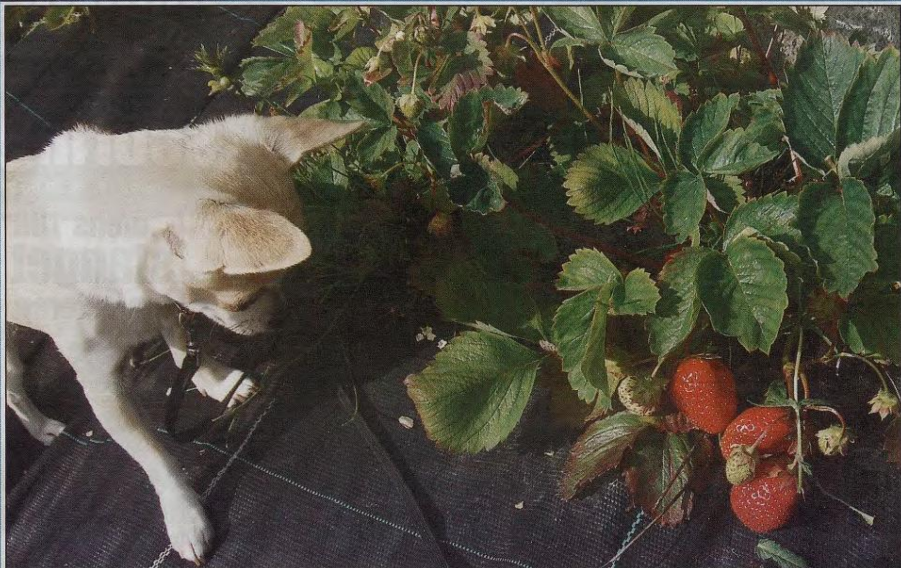
SØTT OG GODT: Jordbærsesongen er i gang og Kompis sjekker årets første modne jordbær på Kvaløysletta.