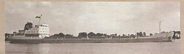
MS JAGONA.