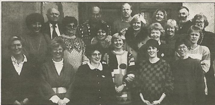
Lærerkollegiet på Haukerød skole fra 1993.