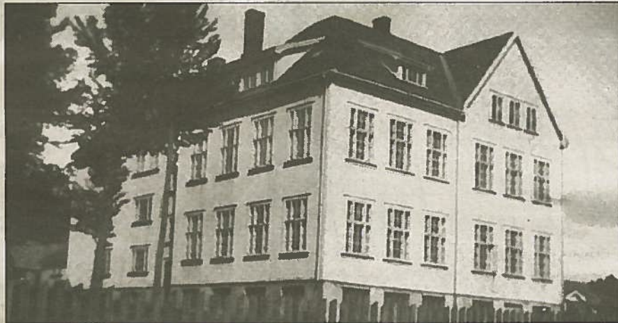
Denne gamle hovedbygningen på Haukerød skole fra 1918 er nå snart borte.

Det skulle gå hele 20 år - til 25. august 1912 - før spørsmålet om sammenslåing kommer opp på nytt i skolestyret, og kretsene ble bedt om en uttalelse knyttet til sammenslåing av de to kretsene. De to kretsene svarer positivt på henvendelsen fra skolestyret, men det stilles krav fra Lundeby skolekrets om at skolen legges nær Haukerødkrysset, og i Bø skolekrets ønsker en at skolen skal