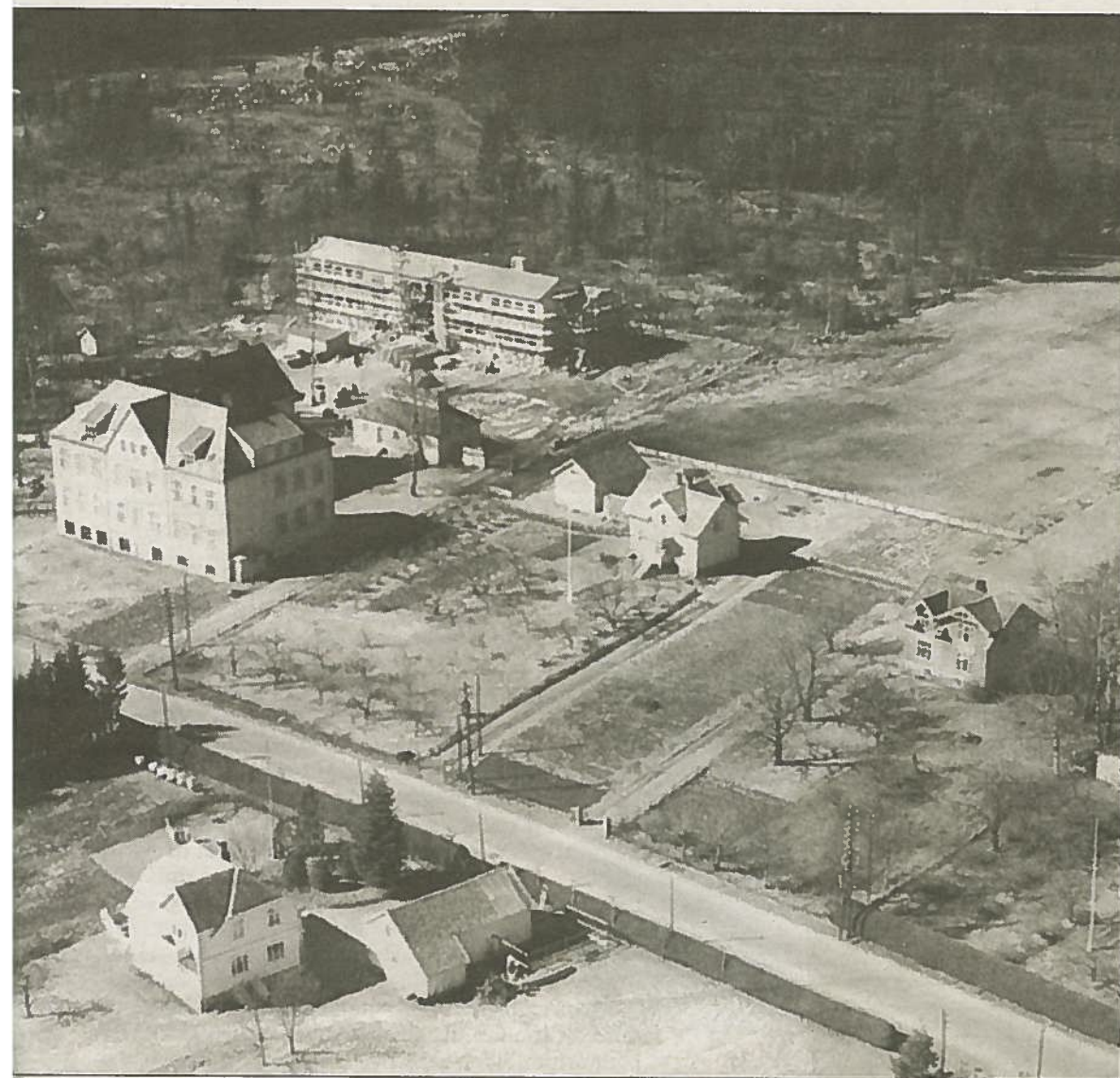
Oversiktsbilde av Haukerød skole med nære omgivelser fra femtiårene er hentet fra boken «Sandefjords historie» av Finn Olstad, bind 2. Man kan se at bygningen på nordsiden er under bygging. Den var ferdigstilt i 1953.