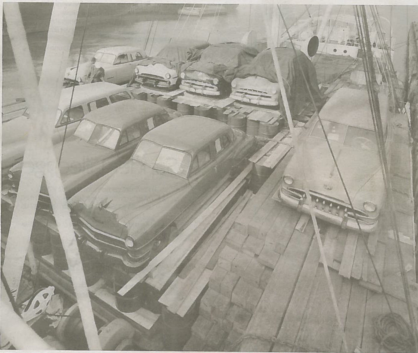
LINJEFART: En av de mest populære skip å komme ombord i for sjøfolk fra Sandefjord gjennom mange år var ms «Thor 1». Den gikk i linjefart på Stillehavet, og dette bildet viser noe av dekklasten i San Francisco 1951. Og lasten er nye Studebakere, Buicker og Oldsmobiles samt Willys jeoper til American Samoa, Fiji, Tahiti og Papua og New Guinea.

De hadde mer variert last enn oss. For dem gikk turen sydover til Durban, for oss gikk det samme veien tilbake til Po-