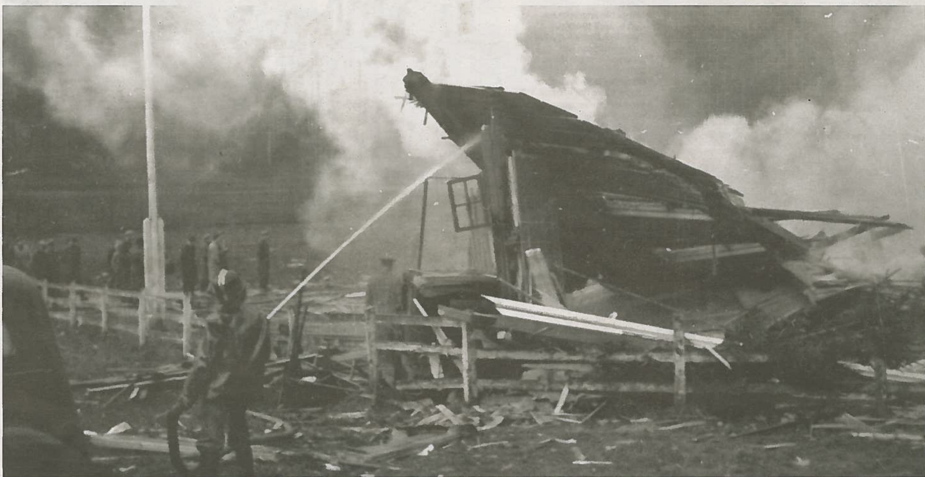
LITE IGJEN Å REDDE: Sandefjord Brannvesen kunne lite gjøre etter eksplosjonen, uten å slukke der det kom røyk. Flaggstangen ble som vi ser merkelig nok stående.