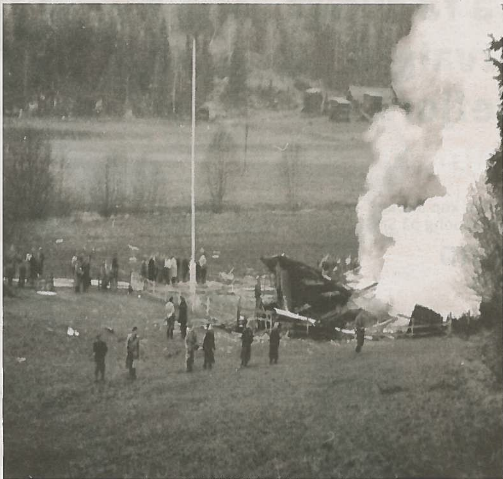
SKUELYSTNE: Folk strømmet til for å se restene av Vonheim etter den forferdelige eksplosjonen i desember 1951.