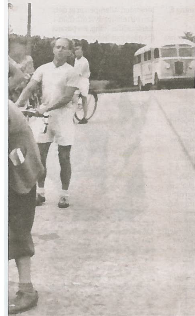
kalt ritt på Raveien.