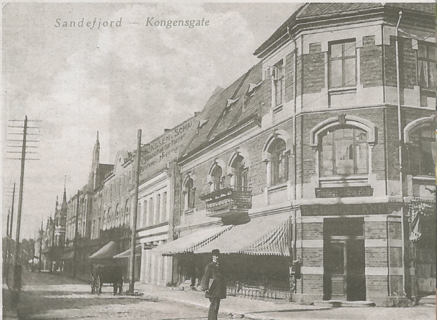
STASELIG: Dette postkortet fra 1913 viser krysset Kongensgate/Jernbanealleen.