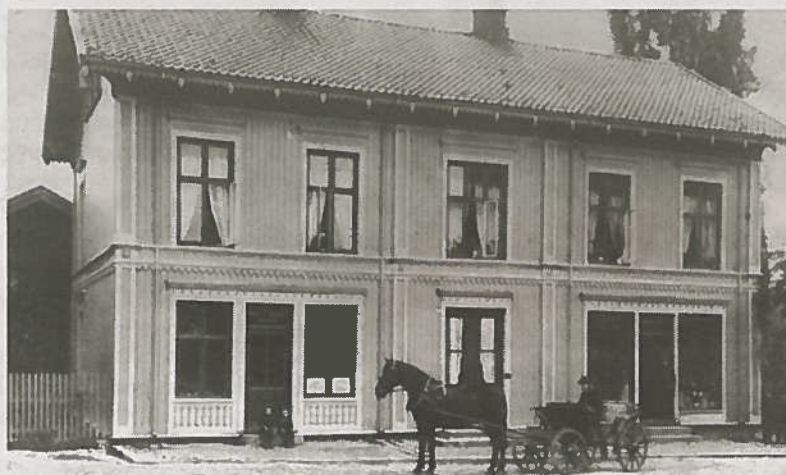
HVOR: Dette huset rommet blant annet en vinhandel. Men hvor lå huset?