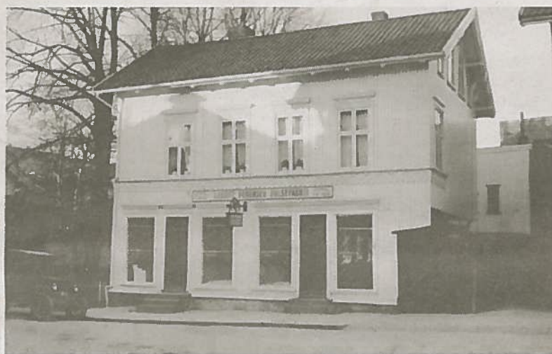
BLE FLYTTET: Dette huset ble flyttet fra Torvet til nederst i Jernbanealleen.