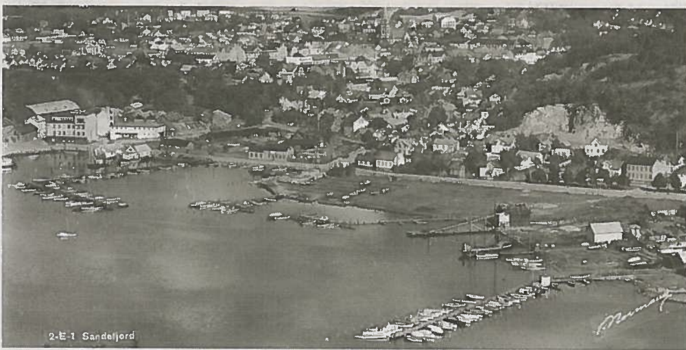
GRØNLI: Litt av Grønli i nederste del av bildet til høyre. Fiskebasarene er ennå ikke flyttet dit hvor Brødrene Berggren holder til nå, og Motorbåtforeningen har sine brygger og opplagsplasser ikke langt fra Grønlibarnas lekeplass.