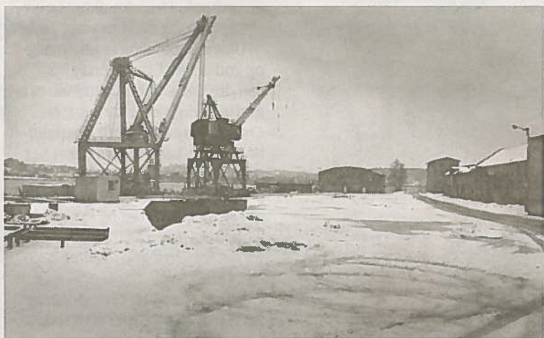
KRANER: Tomt på Framnæskaia etter at stordokka var borte.