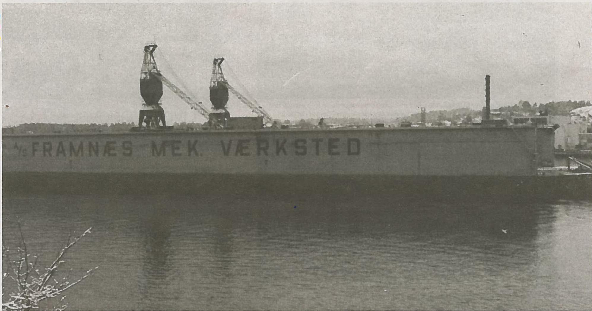
SLEPET: To taubåter måtte til for å slepe stordokka ut fjorden.