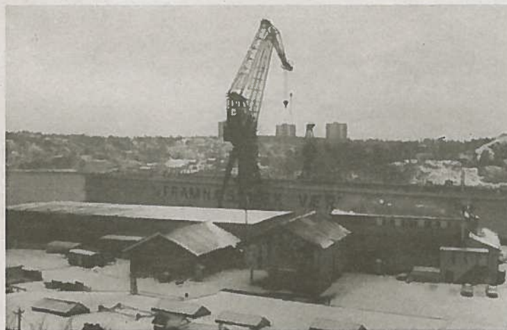
SLEP: Stordokka før den blir slept ut fjorden.