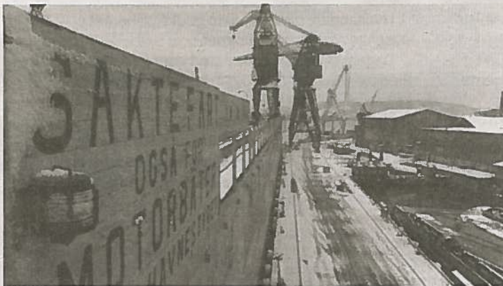
MILJØET: Stordokka og kranene før dokka ble slept ut.