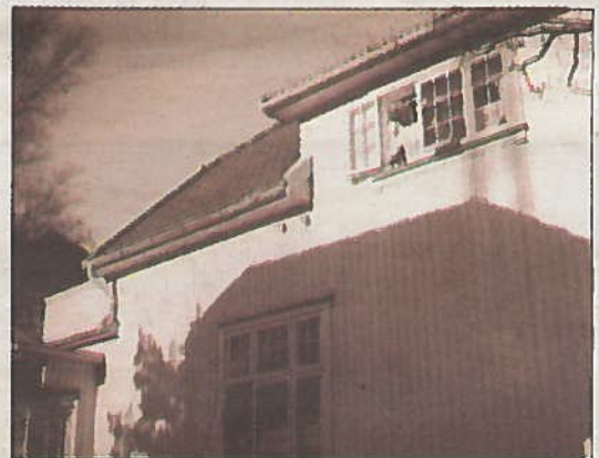
Forfatterens bestemors hjem. Eldre bilde av Virikveien 9.

Jeg visste jo selvsagt ikke det og begynte bare å gråte mer og mer. Min mor var blitt syk og lå