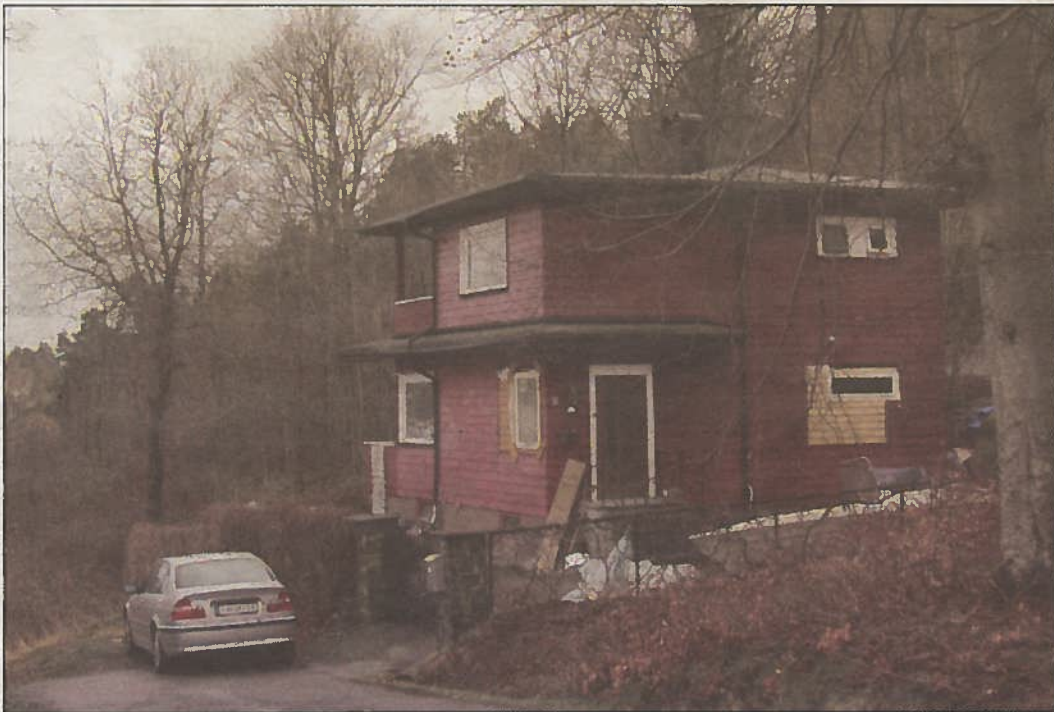
Familien Teiens hjem, nåværende Leikvollgaten 77.