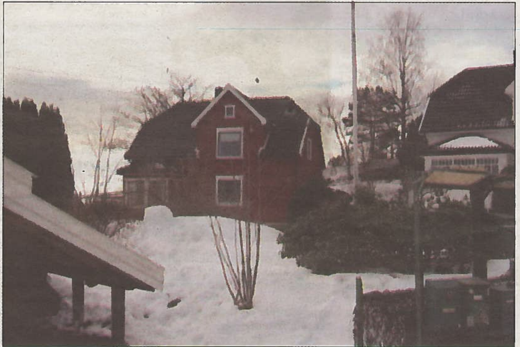
Forfatterens hjem på Hauan, nåværende Hauanveien 43.