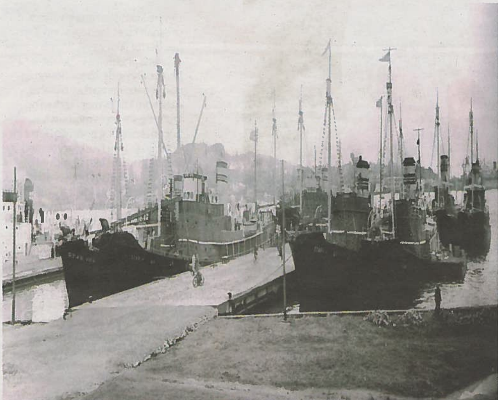
I OPPLAG: Rederiet Rosshavets hvalbåter lå opplagt nær Tollboden om sommeren, men forhalte inn til nærmeste brygge når det nærmet seg avgang til feltet slik vi ser på dette bildet fra 1950-årene.

I 1993-94: Museumsbrygge og gjestehavn. Ny brygge bygget til hvalbåten Southern Actor og vikingskipskopien Gaia og ny gjestehavn ble lagt øst for denne.