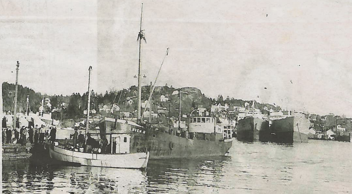
FRAKTESKIPET LØVEN III: Båten var en stadig gjest på Sandefjord havn i etterkrigstida, men bildet viser også sidebåten. Før den kom sto det en annonse i avisen som fortalte om tid og sted for ankomst, og som bildet viser, folk møtte opp og sto i kø for å sikre seg sild i bøtter og spann. Dette var billig og god mat for svært mange i en tid der det var mangel på det meste.

Her kan vi også se brygga som ble anlagt som badebrygge i 1857, rett vest for utløpet til Ruklabekken. Denne ble senere erstattet av Strømbadet, slik vi ser det i dag, bygget i 1869, sør for Park hotell.