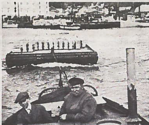
FRAKTEMENN: Mye av utrustningen til hvalflåten ble fraktet fra Brygga på flåter, og dette gamle bildet viser to av fraktemennene på vei utover fjorden til en av fangstbåtene.

Videre ved Ranvik, Lystad, Thorøya, Jahres fabrikk (Pronova Biocare) og Vera