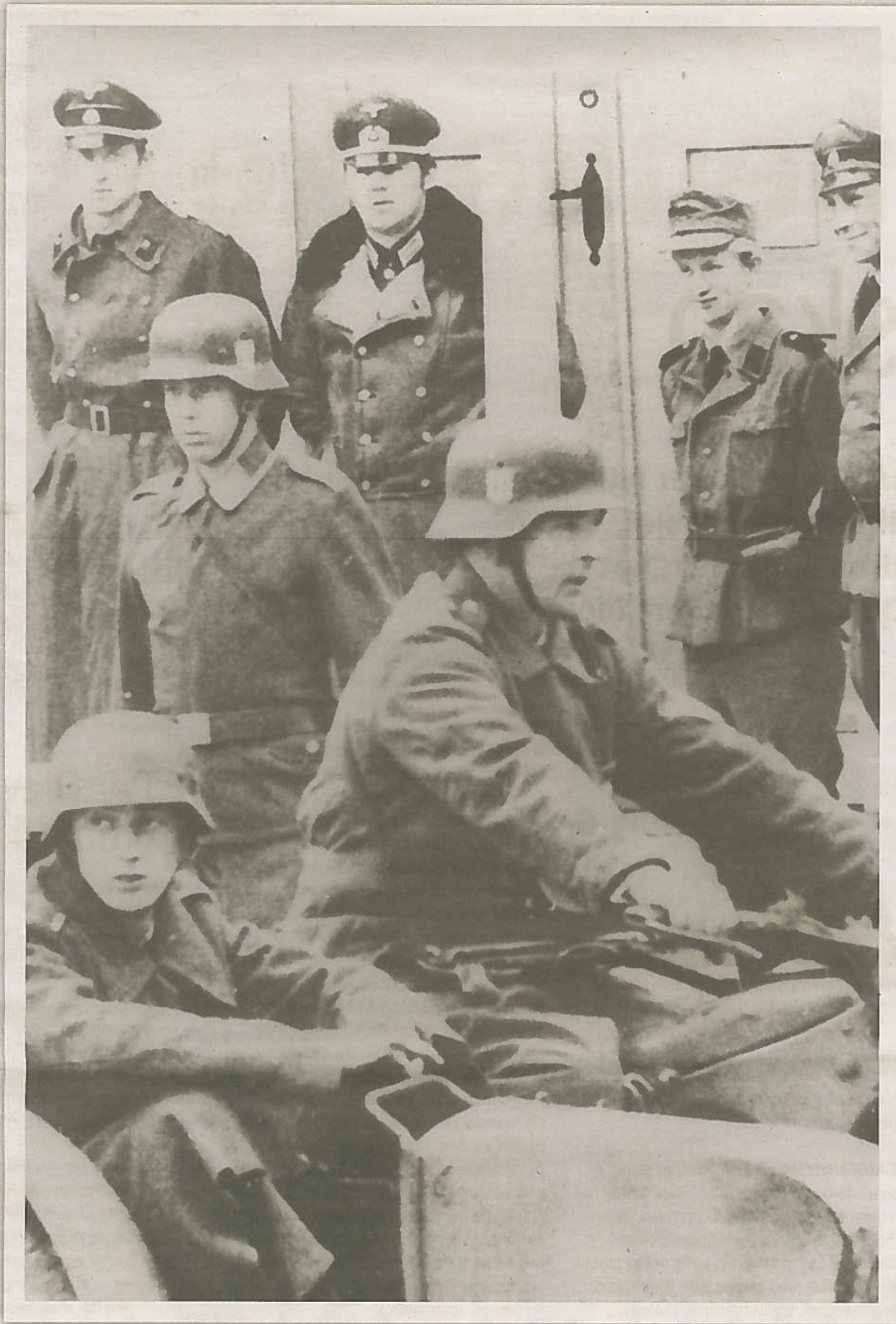
Tidlig på kvelden 4. juledag 1944 gikk flyalarmen. Alle på julefesten på Sandar kommunehus måtte søke tilflukt.