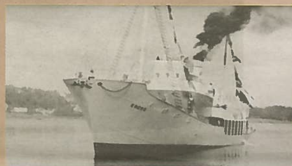
TEKST: RAGNAR IVERSEN (WWW.LARDEX.NET)

Hvalbåten ENERN var den andre med dette navnet, bygget ved A/S Framnæs mek. Værkstéd i 1951 som bygg nr. 148, fikk kun beholde navnet i ett år. Året etter fikk rederiet en ny stor dieseldreven hvalbåt fra Moss Værft som fikk navnet ENERN, og ENERN ble omdøpt TOERN. ENERN ble levert fra verkstedet til A/S Odd (A/S Thor Dahl), Sandefjord i september og gikk til Isen som en del av THORSHAVET-ekspedisjonen sesongen 1951/52. Navnet ENERN stammer fra A/S Atlas (Chr. Nielsen, Larvik), som ble innkjøpt fra Larvik i 1930 og kom under A/S Thor Dahls disposisjon. Alle hvalbåtene til Flk SOLGLIMT hadde tallnavn. Fanget sin siste sesong i 1961/62 for Fl/k THORSHØVDI. Lagt i opplag i Sandefjord fra sommeren 1962. Solgt til Norsk Skipsoppbygning i Grimstad for hugging 28/12-1963.