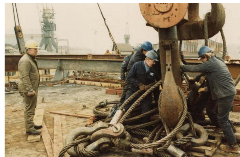
FMV: Et arbeidslag i sving på FMV. Formannen (med gul hjelm) til venstre og arbeiderne (med blå hjelmer) til høyre.

har det vært avgjørende å kunne trekke vekslers på frivillig innsats fra tidligere FMV-ansatte som har god kjennskap til arkivene og verkstedet fra eget yrkesliv.