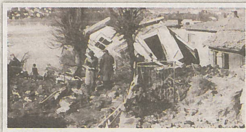
Dette viser huset etter bomberaidet mot Framnes 23. april 1945.

Saker og ting som setter minnene i sving