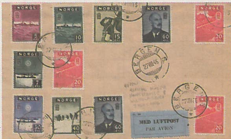
Norske propagandafrimerker gitt ut av Den Norske Regjering i London 1. januar 1943 til bruk på norske skip og i den norske marine.