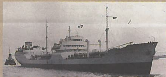
MT SANDEFJORD i Themsen etter navnebytte.