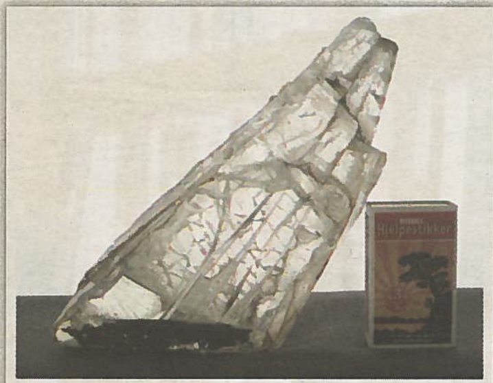
Pleksiglass-splint fra nedskutt bombe fly 1945.