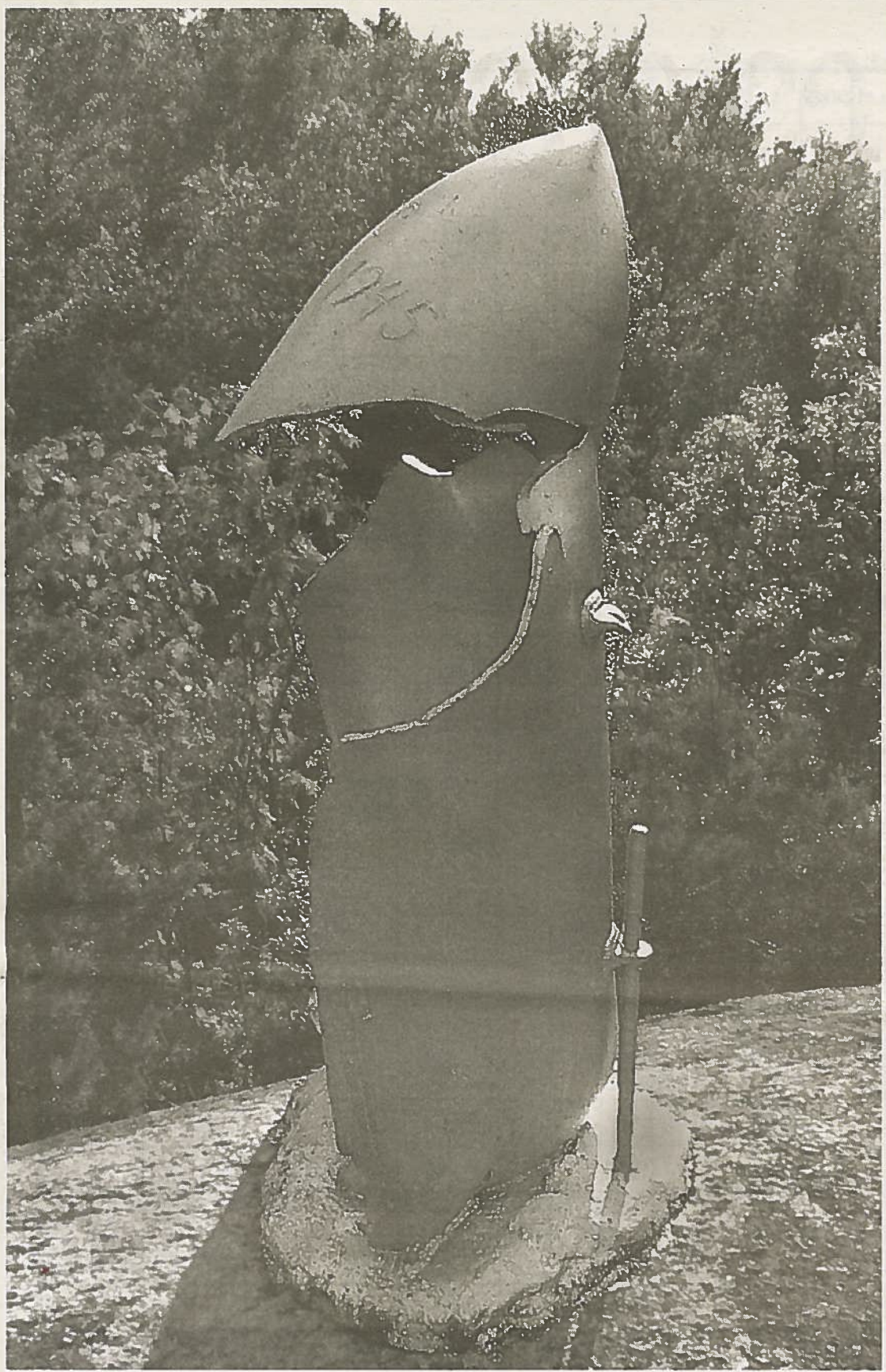
«Ano 26.4.1945» står det på denne bombesplinten som er reist på Hegnaåsen. Bomben ble sluppet i det aller siste flyangrepet på Sandefjord under den andre verdenskrigen. I bakgrunnen kan bebyggelsen på Kamper Bas skimtes. Bildet er tatt i 1983.