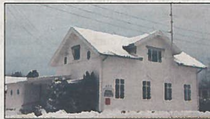
Fevang Bedehus slik det framstår i dag ved siden av Fevang skole.

110 årlige tilstelninger, og i 2011 har det vært 50 sammenkomster.