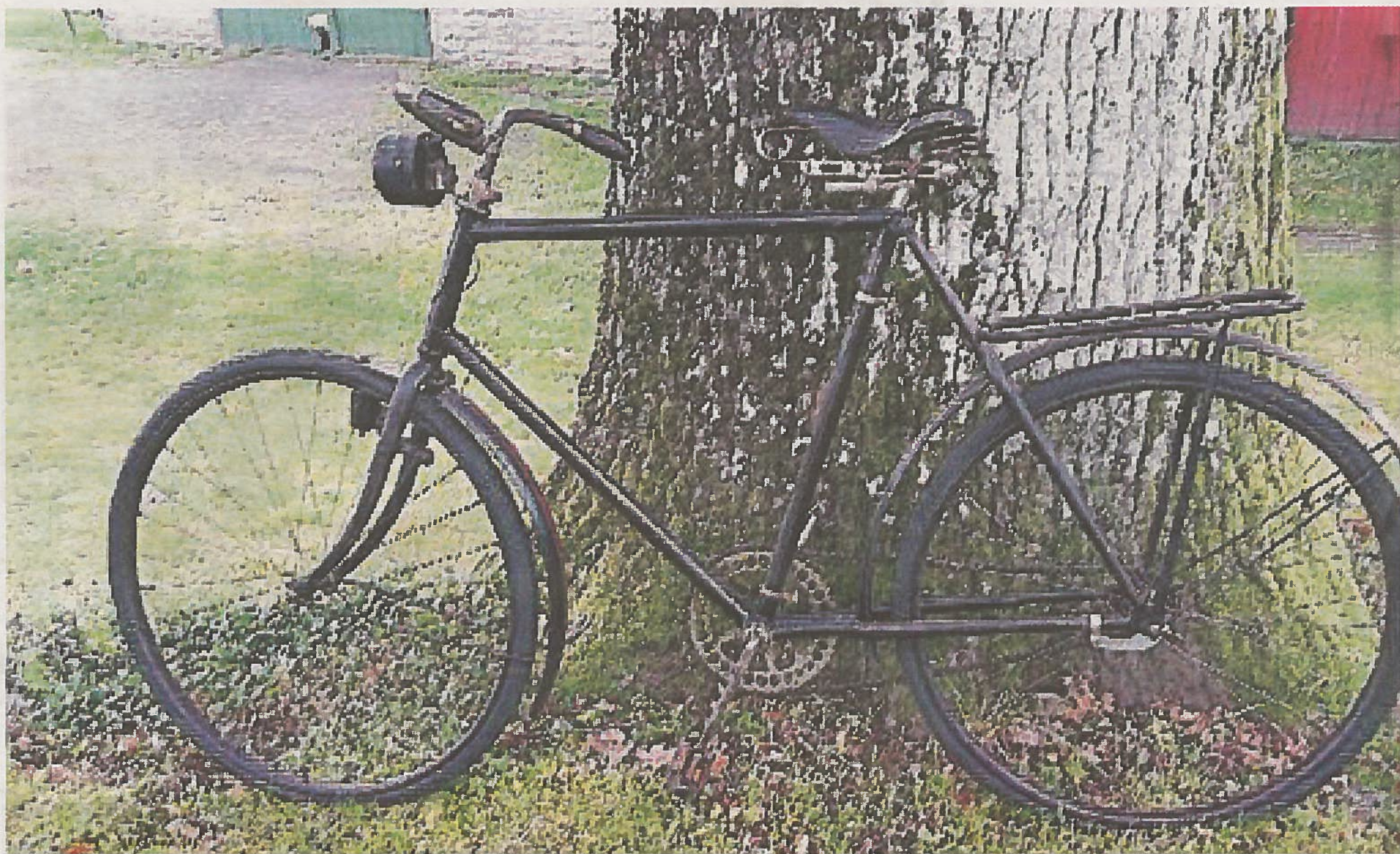
GAMMEL ÅRGANG: Sykkel av eldre fabrikat, trolig en førkrigsmodell.