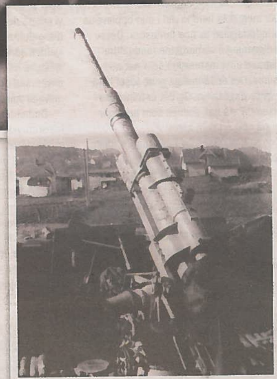
Truende pekte kanonene opp mot himmelen og allierte fly. For naboene på Hasle var de en dyster daglig påminning om at krigen var kommet til Norge.