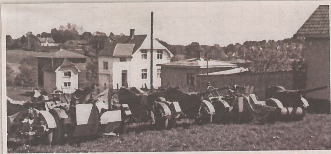
Denne rekken av lettere og mer mobilt luftvern var også oppmarsjert på Hasle.