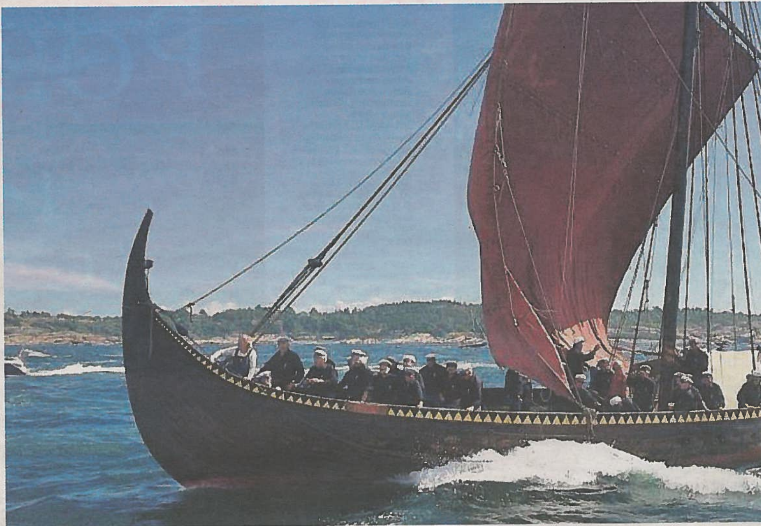
MØTTE SOMMERÅPENT: Sangforeningen og Gaia hilser NRK i fjorden i august.

Viking seilte til Oslo og Bergen, og nådde New York etter 44 dager. Da de kom til Chicago var begeistringens kolossal. Det oppsto Viking-merker over alt; sigarer, sigaretter, endog en Vikingmarsj. Vikingskipet ble liggende i Chicago og for en del år siden var det ønske