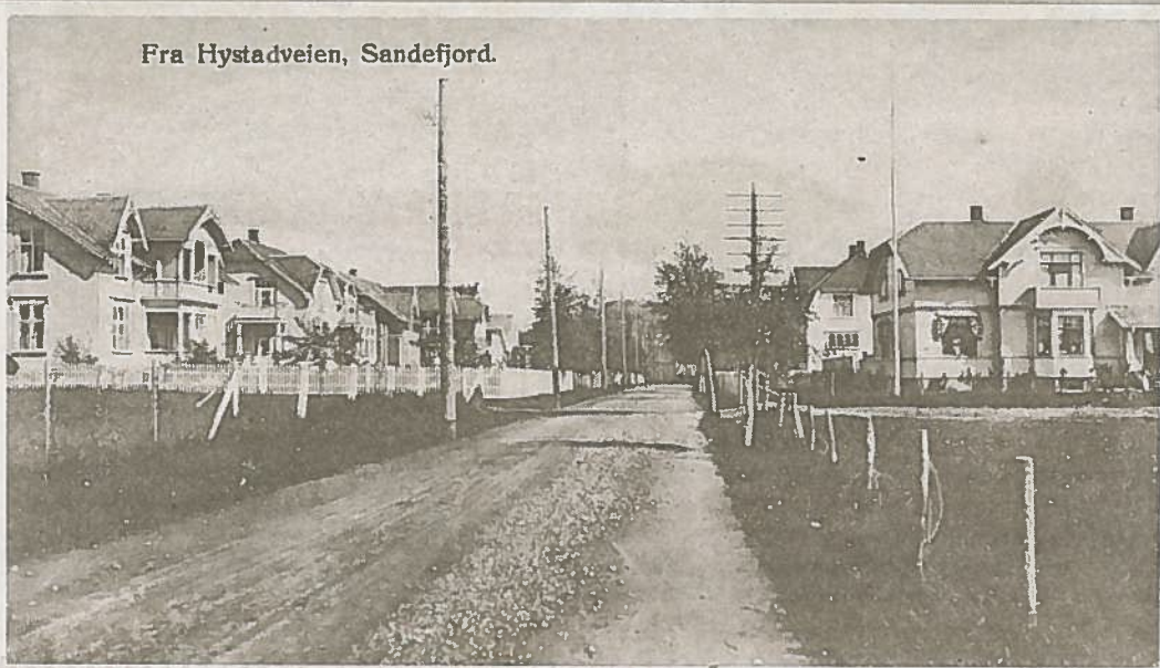
Fra Hystadveien, Sandefjord.