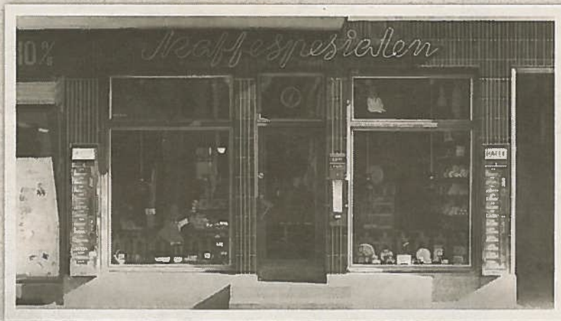
Kaffespesialen hadde neonlysreklame og automater utenfor butikken med nymalt kaffe og sjeldne te-sorter. Det var jo ingenting uten varme pølser og brus å få kjøpt i byen etter kl 16.

Da vi ble litt eldre og fikk lov til å reise til byen alene både lørdagkveldene og 1.mai spaserte alle guttene opp og ned i Storgata for å se på jentene. Og de var vel ute i tilsvarende ærend. Jeg husker fortsatt alle favorittene, men kjenner ikke alle så lett igjen for mange har blitt så lyse i håret eller fått andre og mer varierte farger.