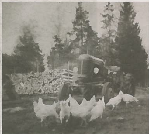
TROLLSÅS: Lekeplassene for barna i Kodal var ofte preget av voksnes arbeide slik som her på Trollsås.