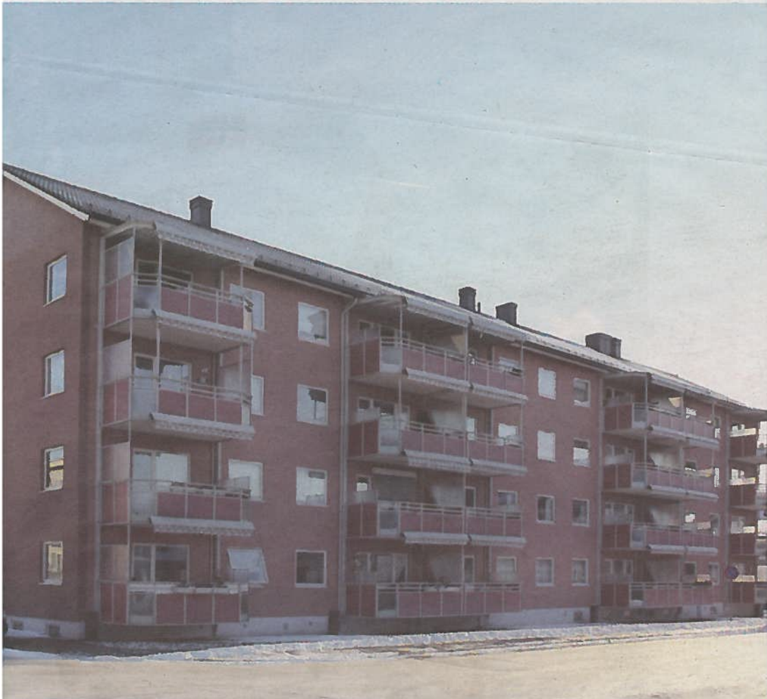
TIDEMANNNS GATE: Disse blokkene i Tidemannns gate minsket boligkøen noe. De ble fort fylt opp av ivrige medlemmer av Sandefjord Boligbyggelag.

Kontaktperson: Sven Erik Lund, tlf. 928 27 154