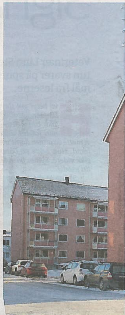
LEIKVOLLGATA: Slik ser Leikvollgata 30 ut i dag over 60 år siden Boligbyggelaget satte i gang med sine første hus etter krigen.