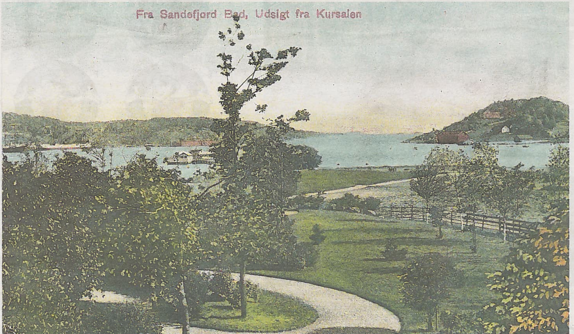
Fra Sandefjord Bad, Udsigt fra Kursalen

IDYLL: Utsikt over badeparken fra Badets festsal ned mot Sjøbadet og Sandefjord Havn. Badeparken var en synlig idyll!