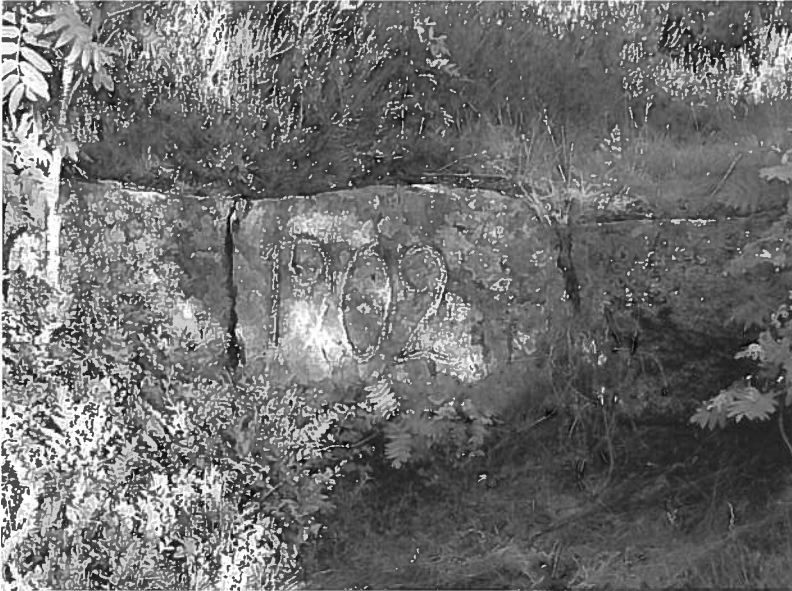
Skansevoll i Søndre Mokollbatteri med anleggsår - 1902.

På den lille gården sin hadde han et «glassmesteri». Ved Mokollveien 40-42 fantes det lenge glassrester. Litt til høyre (ved Mokollveien 50) var det en hoppbakke (3). Det ble avviklet mange friluft- og idrettsstevner i her. Bl a i 1880-1890 årene og i 1901 ble det avholdt amtsskirenn for damer og herrer på løkka. Senere var det bl.a danseløkke her (tvilsomt renomme?).