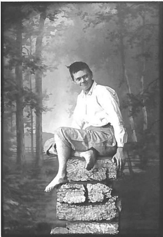
Marie Høeg (1866 – 1949)