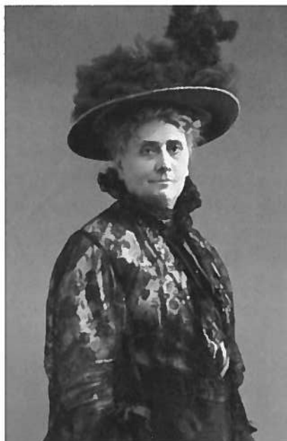
Gina Krog (1847 – 1916)

De mest kjente kvinnene som opererte på riksplan og som hadde aksepten av kvinnestemmeretten som et av sine høyeste mål, var Fredrikke Marie Qvam og Gina Krog. Disse to kvinnene fikk mye av æren for at Norge var tidlig ute med vedtaket av kvinnestemmerettsreformen, og de hadde medspillere rundt om i de fleste byene i Norge. De reiste også rundt til lokalsamfunnene og holdt utallige foredrag for sine lokale medsøstre.