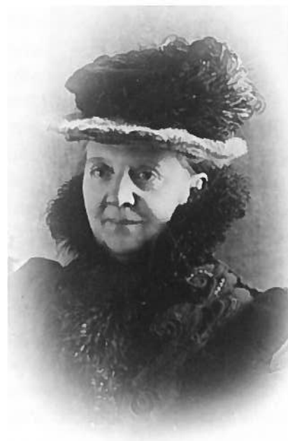
Fredrikke Marie Qvam (1843 – 1938)