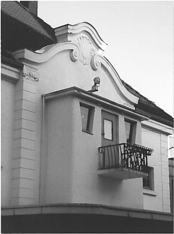
Kongensgate 1c, eller Verdensteateret

med rundt tårn og spir, Storgata 17 (1915), som i sin tid var Sandefjords Skofabrikk A/S. Her er heller sparsomt med fasadedetaljer, men bygningens litt tunge uttrykk er jugendstilens. Arkitekt Rei Himberg .